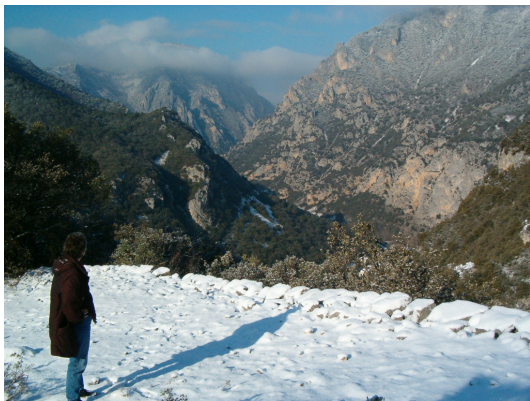
Dette billede er taget den 8. januar 2009 kl. 11.59

Året før kunne vi sidde og nyde solen i små 20 graders varme