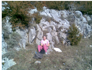
Dette billede er taget den 8. januar 2008 kl. 14.17

Året før kunne vi sidde og nyde solen i små 20 graders varme