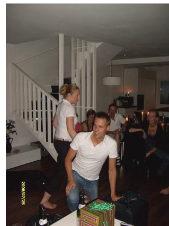
Frokost – og mellem to svigermødre