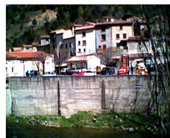
Udsigt ind over byen som består af 48 huse