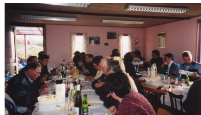
Jo vi er faktisk mange, selv om en del manglede.