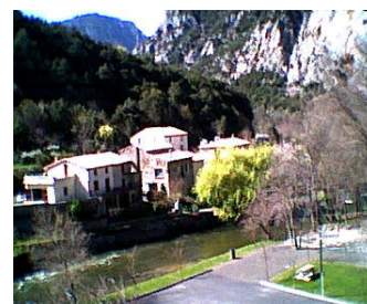
Udsigt fra terrassen. Bemærk Audefloden der løber ligefor, samt de voldsomme bjerge ganske tæt på