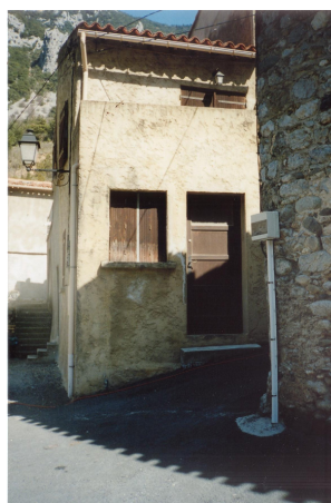
"La Petite Maison" i St. Martin Lys