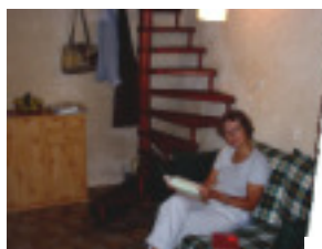
Marianne hygger sig stuen

Placeringen af "La Petite Maison", ca. 60 km fra Middelhavet og ca. 60 km fra Spanien.